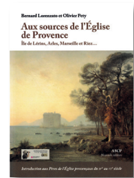
Aux sources de l'Église de Provence Livre